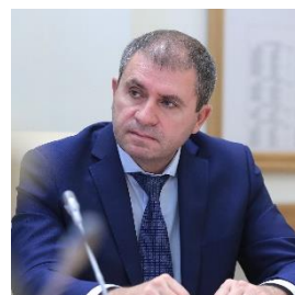
К.Н. Рачаловский, министр сельского хозяйства и продовольствия Ростовской области