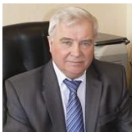
Ю.Ф. Лачуга, академик-секретарь отделения с.-х. наук РАН, академик РАН